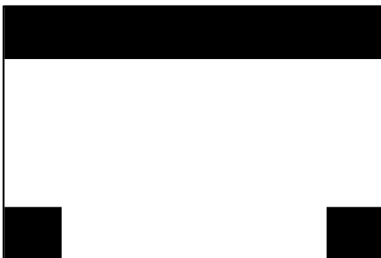
③ ( )